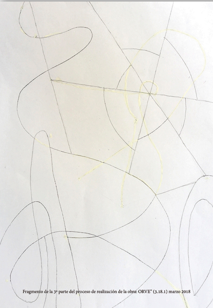
Fragmento de la 3ª parte del proceso de realización de la obra: ORVE" (3.18.1) marzo 2018