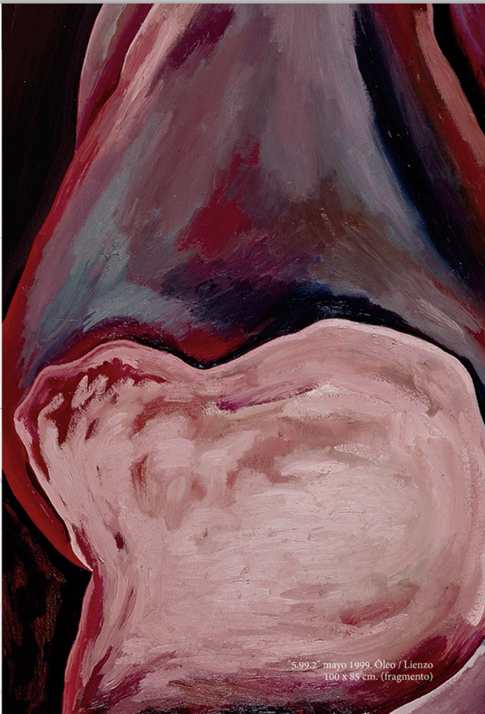
5.99.2 mayo 1999. Óleo / Lienzo 100 x 85 cm. (fragmento)